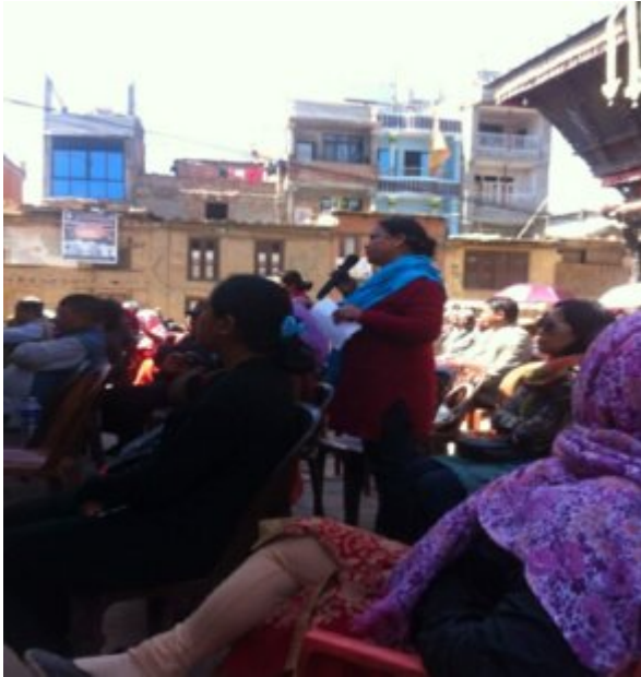
उपस्थित स्थानीय बाि न्दा प्रश्न ोध्दै