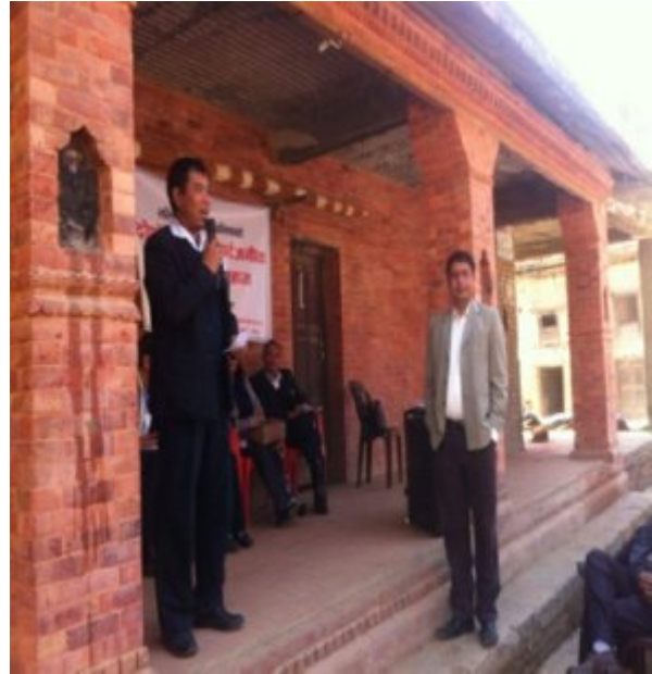
राजश्व प्रशा न महाशाखा प्रमुख गुना े म्बोधन गर्दै