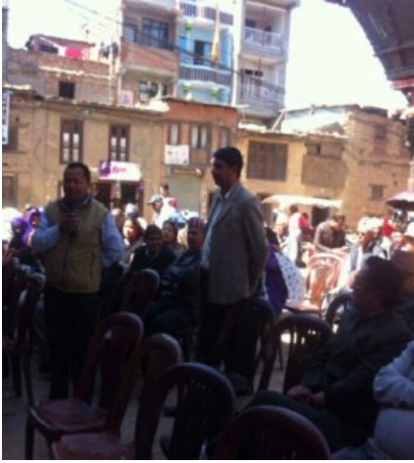
उपस्थित स्थानीय बाि न्दा प्रश्न ोध्दै