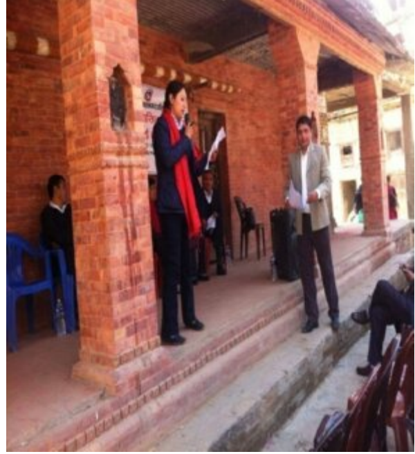
जनस्वास्थ्य अधिकृत आफुनो प्रस्तुतिकरण गर्दै