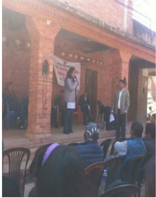
महाशाखा प्रमुखहरु आ आफ्नो कार्य प्रस्तुतिकरण गर्दै